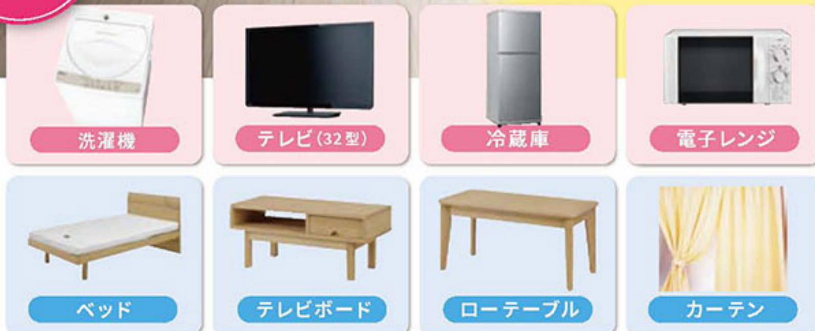
家具・家電製品の設置イメージ

※お部屋ごとに設置される家具・家電のデザインや色などの仕様は異なります。お客様での選択・変更 は出来かねますのでご了承ください。 ※設置品の使用にあたり発生する受信料等の費用は賃借人の負担となります。 ※お部屋のタイプによって設置品が異なる場合があります。詳しくは担当者までおたずねください。